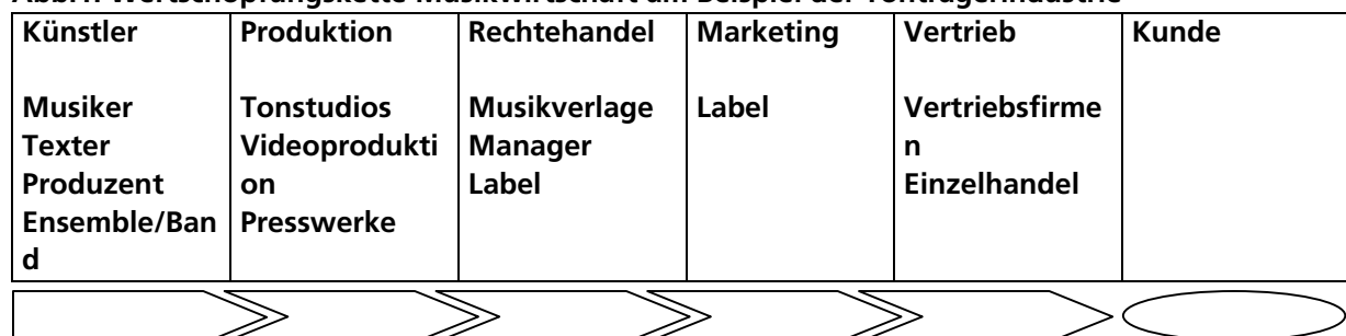
Abb.1: Wertschöpfungskette Musikwirtschaft am Beispiel der Tonträgerindustrie

Für die Musikwirtschaft ist es äußerst wichtig, dass die Qualität und das Wirtschaftswachstum auf jeder Stufe der Wertschöpfungskette entwickelt wird. Dies geht von der Künstlerförderung, die oft in Jugend-Zusammenhängen erfolgt, über die Förderung von Popkultur und -verbreitung als Aufgabe der Kulturverwaltungen, bis hin zur Förderung der Verwertung und Distribution, die einen Kernbereich der Wirtschaftsförderung darstellt. Quer dazu müssen die Bereiche Infrastruktur (Gewerbeflächen, Veranstaltungsräume, Messen, Logistik, Mobilität), Personal (Gewinnung/Marketing Standort, Qualifizierung,...), Technologie (Konvergenz der Medien,...) und Beschaffung (Werbebranche, Instrumentenhersteller,...) entwickelt werden. Wichtig ist es hierbei eine Balance zwischen den Aktivitäten zu finden, die eine gleichwertige und nachhaltige Berücksichtigung auch von Firmen und Institutionen aus unterschiedlichen Bereichen ermöglicht.